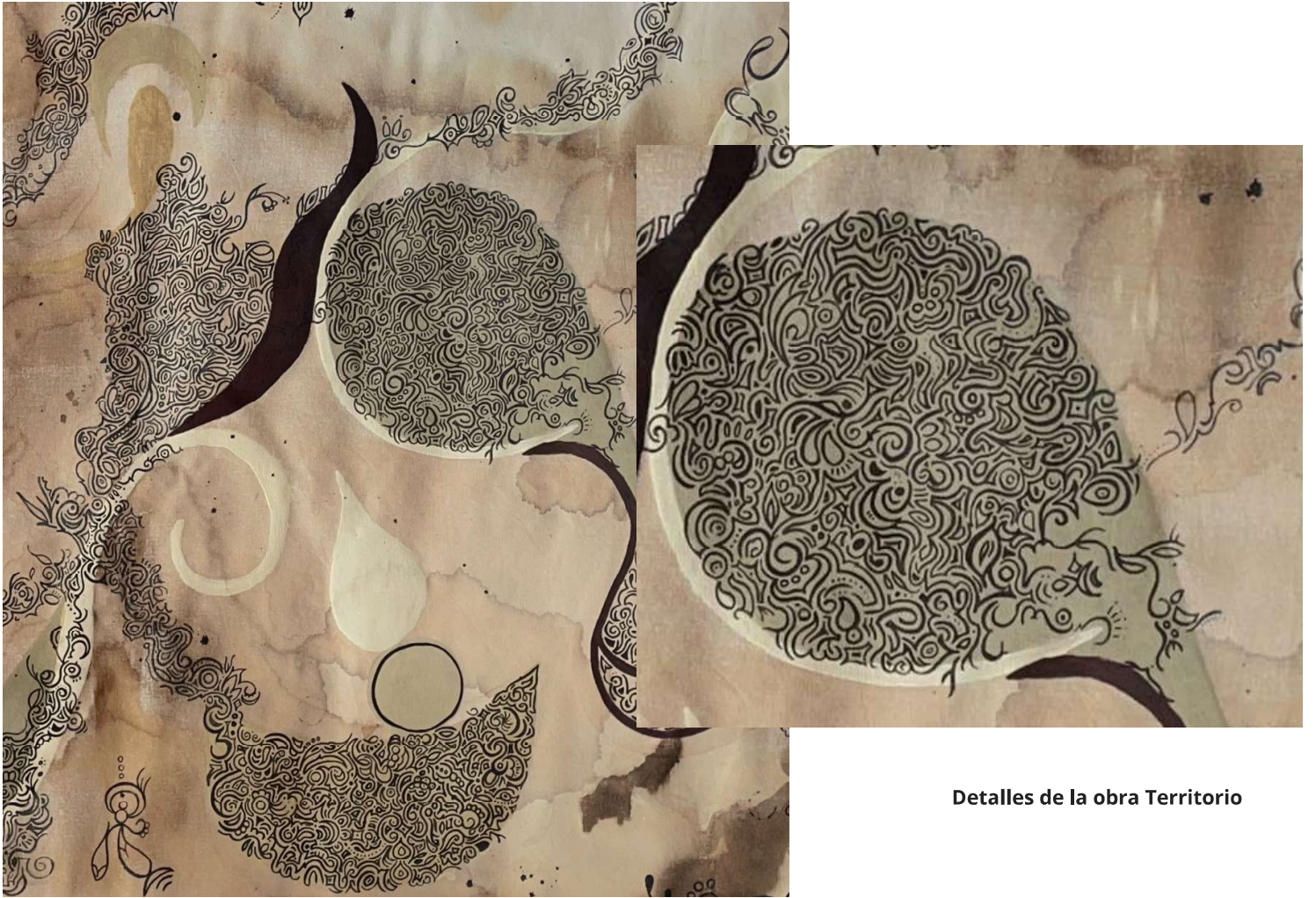
Detalles de la obra Territorio