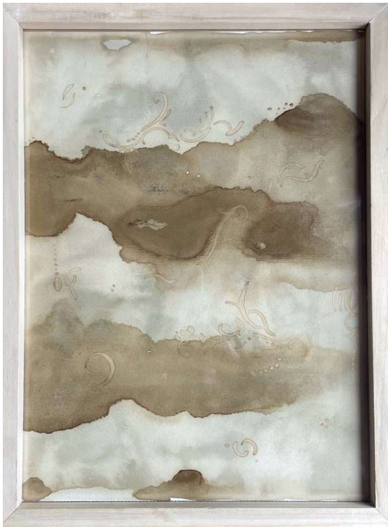
Abyecto Mate y café sobre papel 44 x 32 - Año 2025