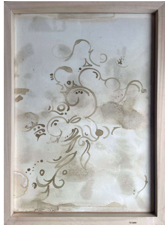
Eter Mate y café sobre papel 44 x 32 - Año 2025