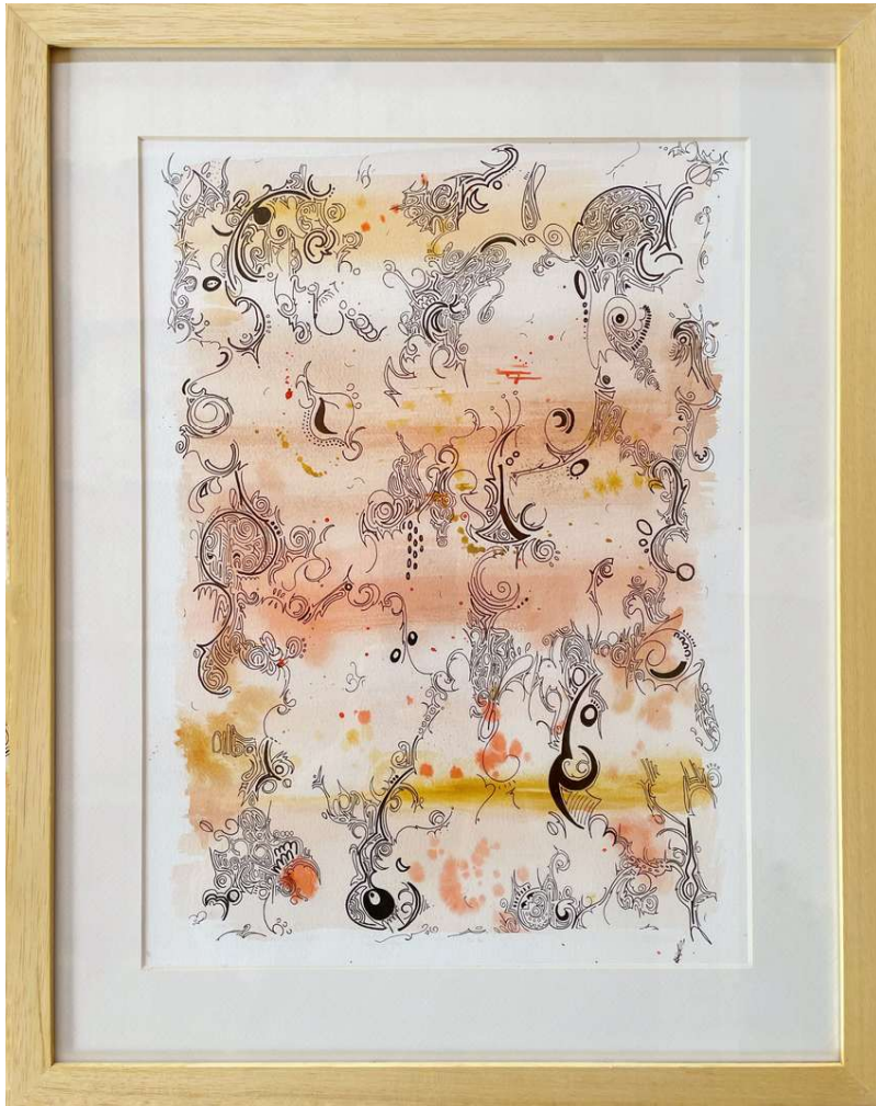
Mística Acuarela y tinta sobre papel 50 x 40 - Año 2021

Luz Marina Kaplan - www.luzmarinakaplan.com.ar - t.e: 1131567606